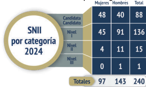
Gráfica 06. SNII por categoría, 2024