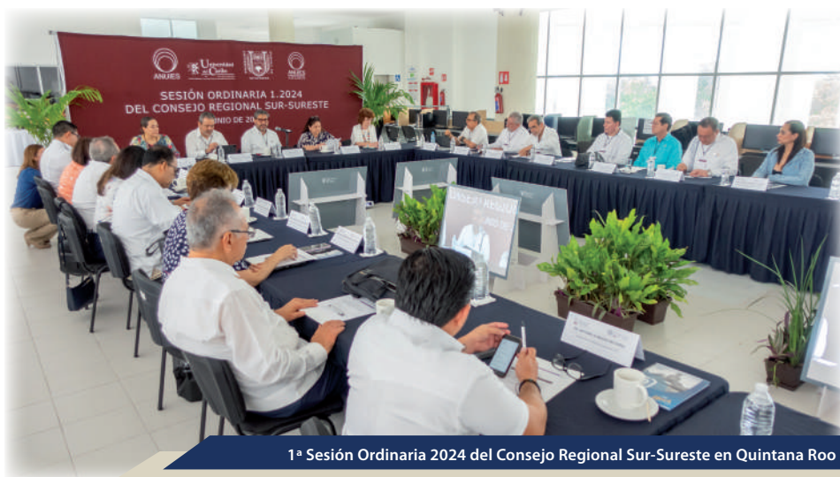
1ª Sesión Ordinaria 2024 del Consejo Regional Sur-Sureste en Quintana Roo

La institución es miembro activo de redes nacionales e internacionales como la Red Nacional Alttexto, que integra más de 54 editoriales univer-