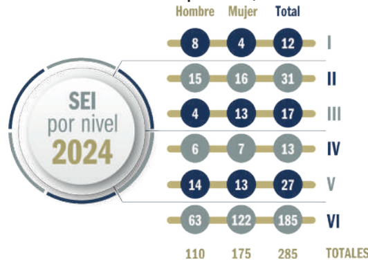
Gráfica 07. SEI por Nivel, 2024