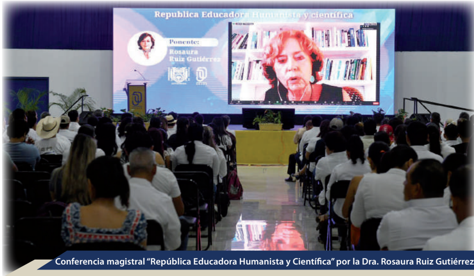
Conferencia magistral “República Educadora Humanista y Científica” por la Dra. Rosaura Ruiz Gutiérrez

titulado “La Investigación como Base del Desarrollo Empresarial”, enalteciendo el evento con una participación 80 docentes, 32 mujeres, 42 hombres; 48 estudiantes, 20 mujeres, 28 hombres, en colaboración con el Centro Universitario de San Marcos de la Universidad de San Carlos de Guatemala. Este encuentro virtual destacó la importancia de la cooperación entre académicas y académicos de ambas universidades, dada la similitud de los desafíos que enfrentan las regiones de México y Centroamérica. Durante el congreso se presentaron contribuciones teóricas y metodológicas, hallazgos de investigación y propuestas para abordar problemas específicos de cada país, lo que permitió avanzar en el desarrollo empresarial y fortalecer la formación académica continua de docentes y estudiantes.