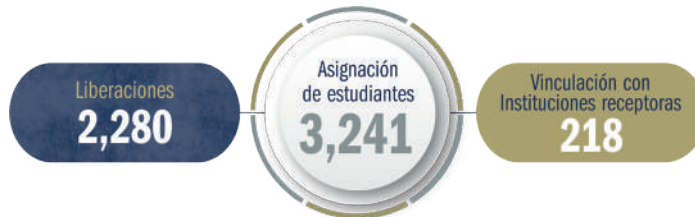
Gráfica 09. Asignación y atención estudiantes de servicio social, 2024