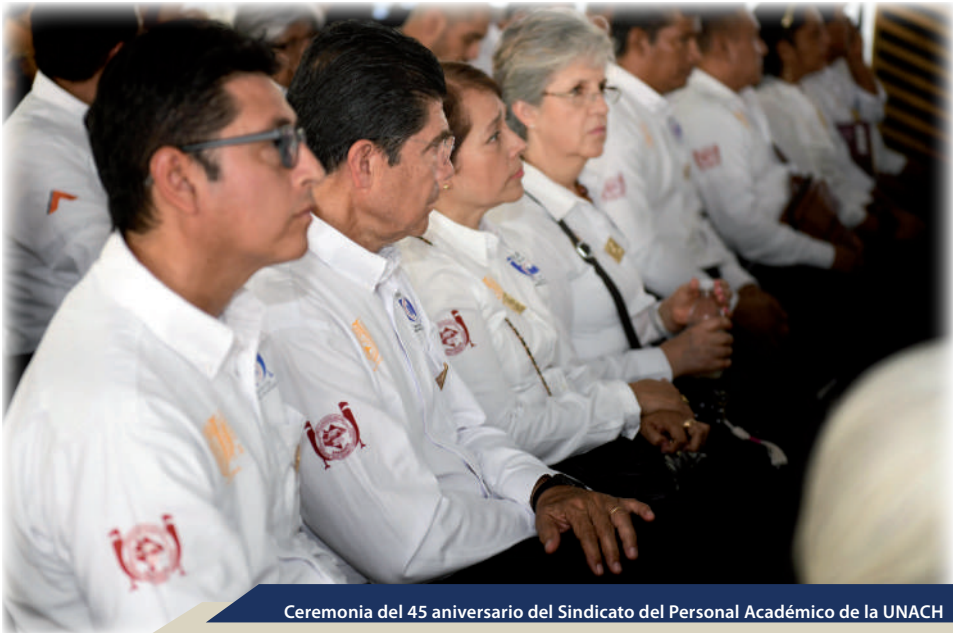
Ceremonia del 45 aniversario del Sindicato del Personal Académico de la UNACH

La docencia, entendida como un proceso integral de formación académica, humana y social, ha impulsado el crecimiento y la transformación de la Universidad Autónoma de Chiapas (UNACH). A lo largo de estos 50 años, la universidad no solo ha formado a miles de profesionales, sino que ha dejado una huella profunda en el desarrollo de nuestro Estado. Lo que comenzó como un sueño inspirado por la visión de personas pioneras y benefactoras, evolucionan hasta convertirse en una institución que no solo educa, sino que inspira y trasciende límites.