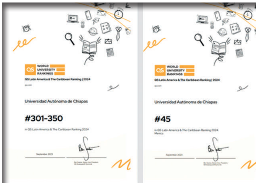
Posición regional y nacional de la UNACH en la edición 2024 del QS Ranking