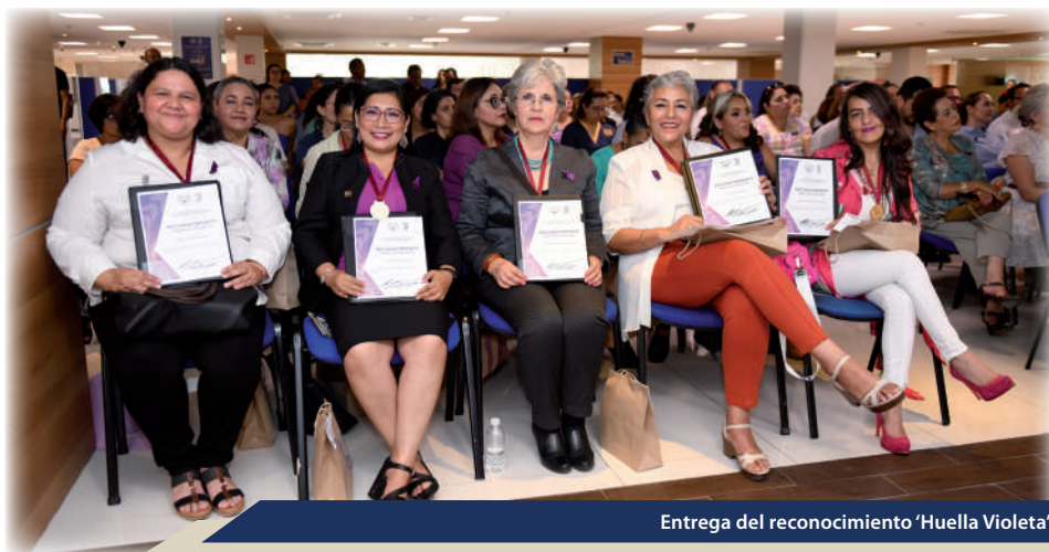
Entrega del reconocimiento 'Huella Violeta'

En su 50 aniversario, la Universidad Autónoma de Chiapas impulsa la igualdad de género, la creación de espacios libres de violencia y la protección de los derechos universitarios. Este informe destaca los avances en estas áreas, reflejando su labor constante por construir una comunidad inclusiva y segura para todos. Estos valores forman parte de la identidad institucional de la UNACH, reflejando su responsabilidad social y su dedicación a construir un entorno inclusivo y seguro para toda su comunidad. A lo largo de cinco décadas, la UNACH ha trabajado para garantizar que cada integrante pueda desarrollarse plenamente en un ambiente de respeto y equidad, en concordancia con los principios universales de derechos humanos y con un enfoque especial en la eliminación de cualquier forma de violencia. Este aniversario marca una oportunidad para redoblar esfuerzos y consolidar políticas y programas