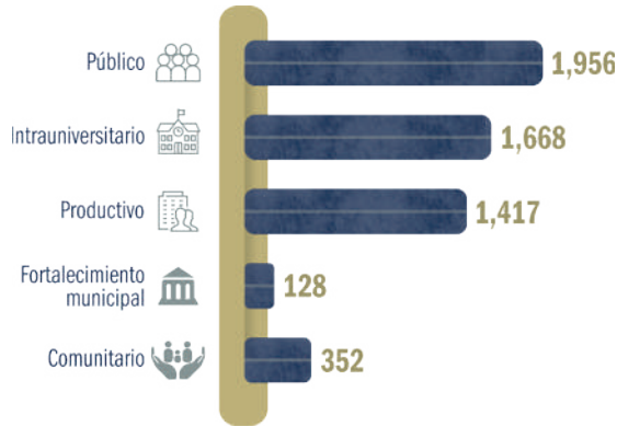
Gráfica 08. Estudiantes prestadores de servicio social, 2024

Fuente: Secretaría de Identidad y Responsabilidad Social Universitaria.