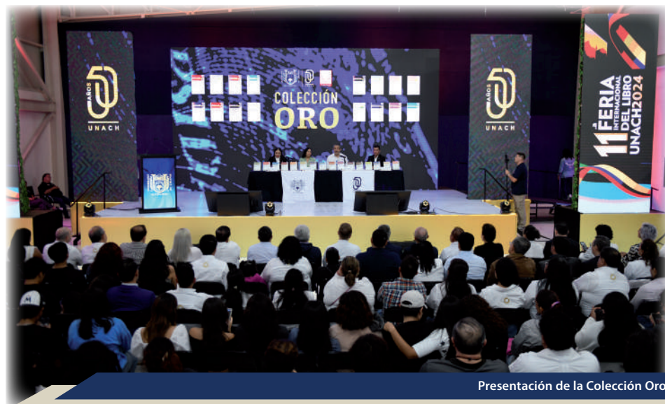
Presentación de la Colección Oro