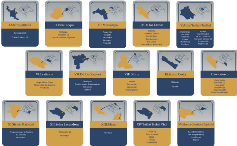
Gráfica 01. Total de sedes por región socioeconómica

Fuente: Dirección General de Docencia y Servicios Escolares.