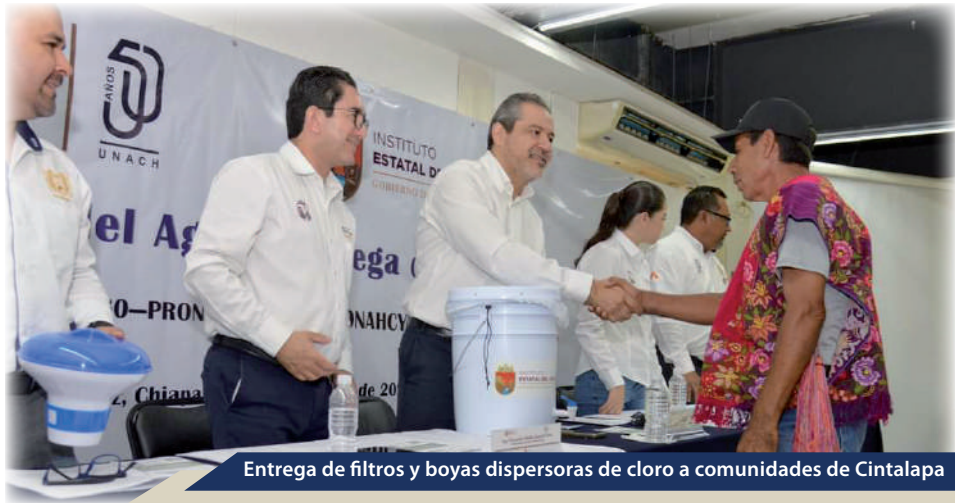
Entrega de filtros y boyas dispersoras de cloro a comunidades de Cintalapa

intervenciones en las comunidades para mejorar el acceso al agua potable y promover prácticas sostenibles en su uso. Estas iniciativas buscan contribuir al bienestar de las comunidades y al manejo eficiente de los recursos hídricos, subrayando el compromiso de la UNACH y el INESA en la mejora de la calidad de vida en la región.