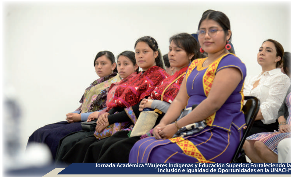
Jornada Académica "Mujeres Indígenas y Educación Superior: Fortaleciendo la Inclusión e Igualdad de Oportunidades en la UNACH"