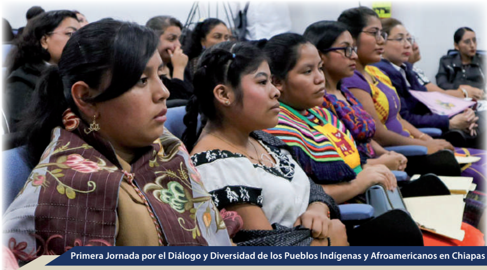
Primera Jornada por el Diálogo y Diversidad de los Pueblos Indígenas y Afroamericanos en Chiapas

En el marco de las celebraciones por el Día Internacional de los Pueblos Indígenas, el 9 de agosto, la Dirección de Programas para la Promoción de la Inclusión Social, en colaboración con la Dirección para el Diálogo con la Diversidad (DIADI), organizó la primera Jornada por el Diálogo y Diversidad de los Pueblos Indígenas y Afroamericanos