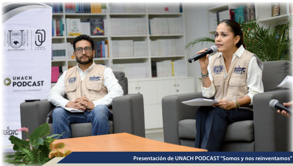
Presentación de UNACH PODCAST “Somos y nos reinventamos”