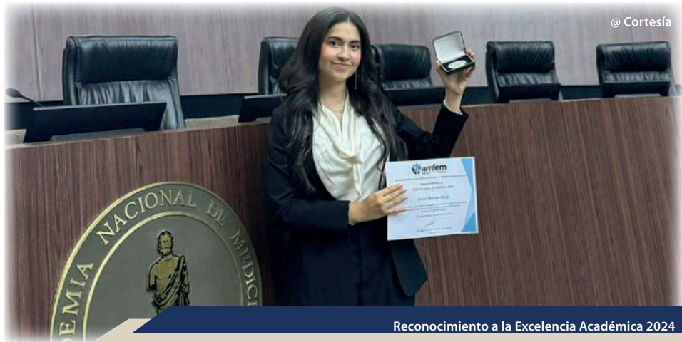
Reconocimiento a la Excelencia Académica 2024

Egresados. Estos estudios representan un valioso recurso para analizar el desempeño y necesidades de los egresados en su vida profesional, reafirmando el compromiso de la universidad con su seguimiento y apoyo en la inserción laboral y su contribución a la sociedad.