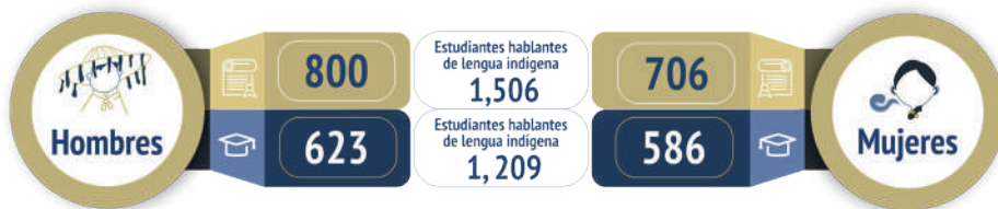
Gráfica 04. Estudiantes hablantes de lengua indígena o pertenecientes a un grupo étnico