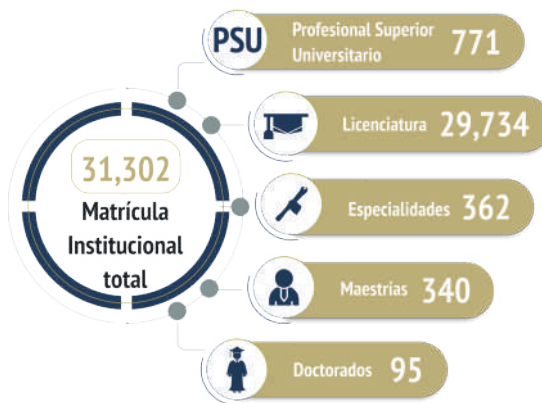
Gráfica 02. Matrícula institucional por nivel académico, 2024