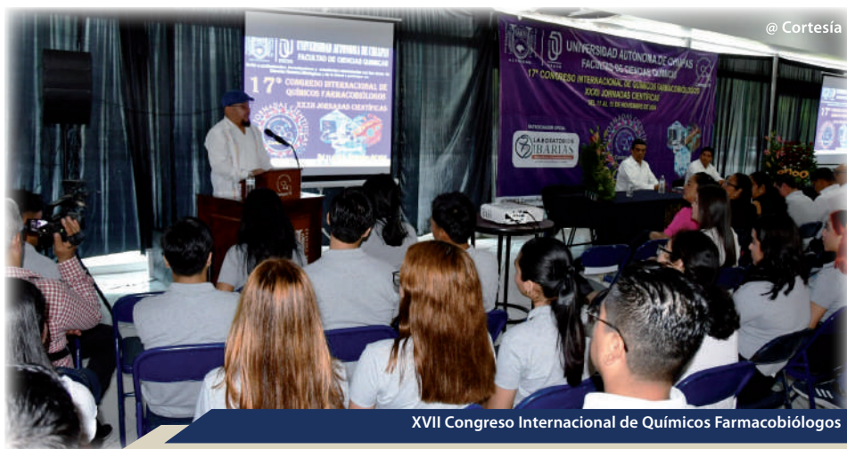
XVII Congreso Internacional de Químicos Farmacobiólogos

En paralelo, en colaboración con la Escuela de Sistemas Alimentarios, se organizó el Primer Encuentro de Intercambio de Saberes para el Rescate Biocultural de las Plantas Medicinales. En este evento, se realizaron cuatro ponencias y seis talleres enfocados en la importancia del patrimonio biocultural de Chiapas, enalteciéndolo con su presencia 80 participantes entre ellos, destacados investigadores, docentes y estudiantes, subrayando su relevancia tanto para la salud comunitaria como para la preservación de la biodiversidad.