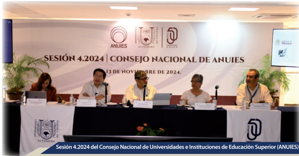
Sesión 4.2024 del Consejo Nacional de Universidades e Instituciones de Educación Superior (ANUIES)

La Universidad Autónoma de Chiapas fue sede de la sesión 4.2024 del Consejo Nacional de Universidades e Instituciones de Educación Superior (ANUIES), celebrada en el marco de la Conferencia Internacional ANUIES-AMPEI-AMEREIAF, encabezada por el secretario de