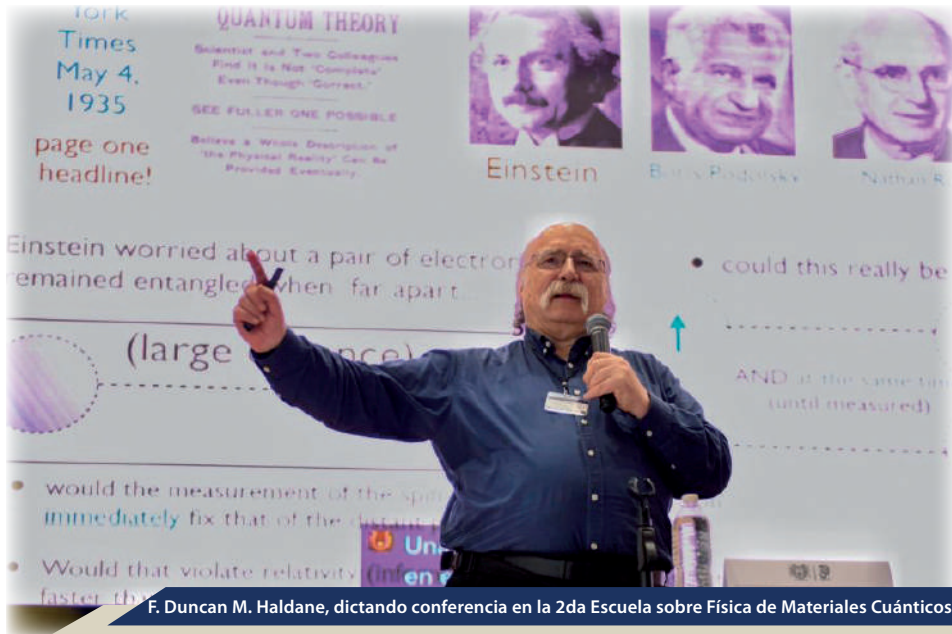
F. Duncan M. Haldane, dictando conferencia en la 2da Escuela sobre Física de Materiales Cuánticos

Asimismo, entre el 15 y el 18 de octubre, la Facultad de Ciencias en Física y Matemáticas organizó la 2da Escuela sobre Física de Materiales Cuánticos, que contó con la participación de F. Duncan M. Haldane, galardonado con el Premio Nobel de Física en 2016. En la conferencia inaugural, realizada en el auditorio de Los Constituyentes y transmi-