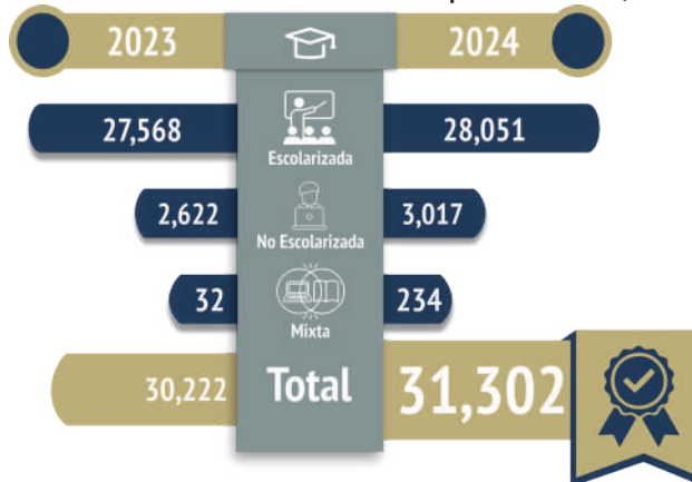
Gráfica 03. Evolución de la matrícula por modalidad, 2024