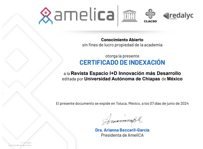
Certificado indexación Amelica para la Revista Espacio I+D. Innovación más Desarrollo 2024

superior, redes de colaboración y organismos de investigación en México. Igualmente, se publicaron los números ordinarios: Vol. 13 Núm. 35 (2024): febrero-mayo, Núm. 37, Volumen 13 junio-septiembre, y Núm. 38, Volumen 13 octubre-enero