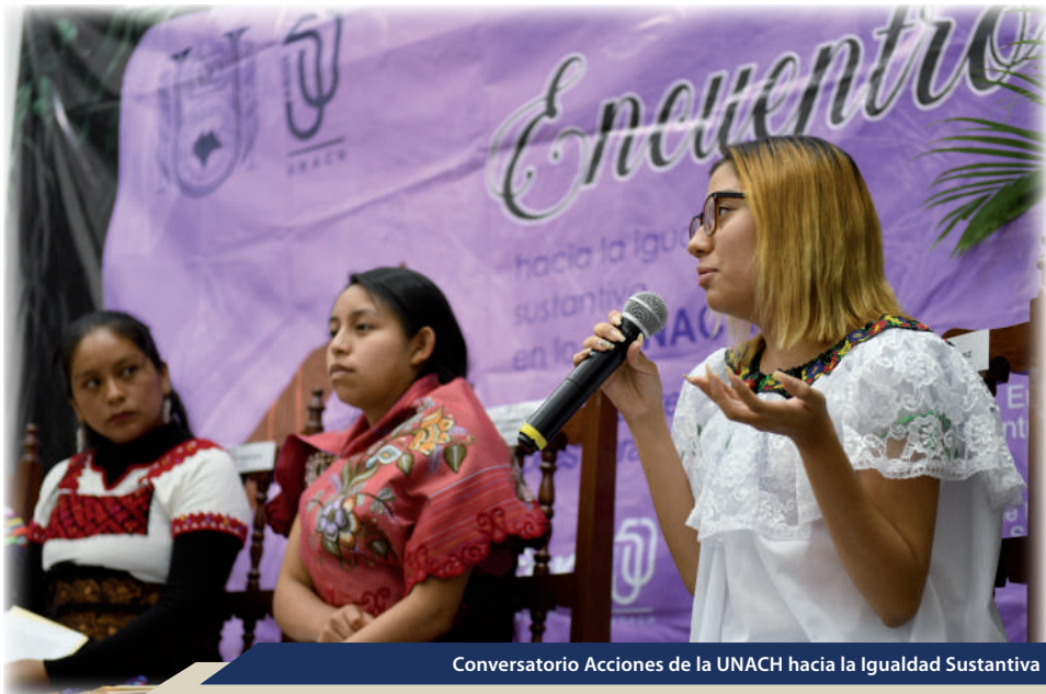
Conversatorio Acciones de la UNACH hacia la Igualdad Sustantiva