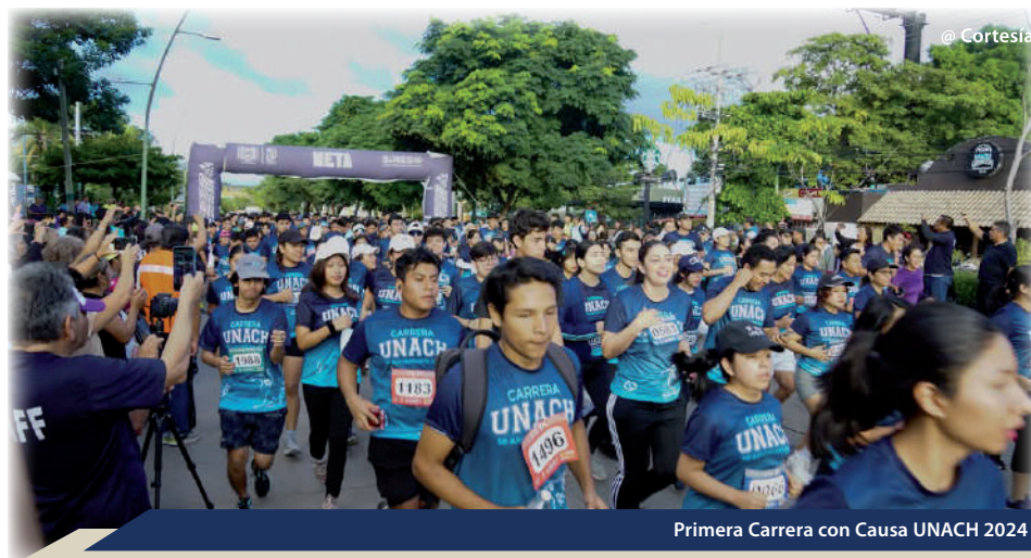
Primera Carrera con Causa UNACH 2024

Igualmente, la Secretaría de Identidad y Responsabilidad Social Universitaria (SIRESU) organizó la primera Carrera con Causa UNACH 2024, una actividad conmemorativa en el marco de los 50 años de la Universidad Autónoma de Chiapas. Este evento promovió valores como la salud, la integración comunitaria y el fortalecimiento de la identidad universitaria, reflejando el compromiso de la UNACH hacia el bienestar y desarrollo de su comunidad. La carrera contó con la participación de 3,149 personas, entre estudiantes, docentes y miembros de la sociedad en general, quienes recorrieron distancias de 3, 5 y 10 kilómetros en las