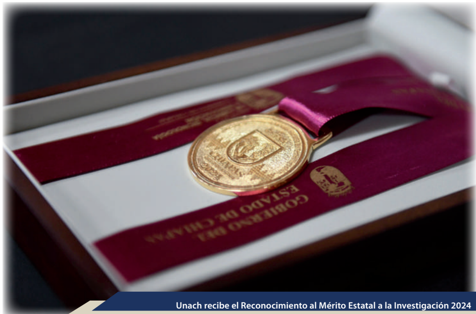
Unach recibe el Reconocimiento al Mérito Estatal a la Investigación 2024

En el marco de las acciones para fortalecer la formación y el desarrollo profesional del personal académico, la Universidad Autónoma de Chiapas organizó la 16ª edición del Congreso Mesoamericano de Investigación UNACH (CMIU), que contó con la colaboración del Instituto de Ciencia, Tecnología e Innovación del Estado de Chiapas, el Consejo Regional Sur Sureste de la ANUIES y la Universidad Juárez Autónoma de Tabasco. La página web del evento registró una afluencia de 23,497 usuarios durante el período de abril a septiembre de este año. Este magno evento, realizado de manera virtual del 2 al 6 de septiembre, presentó las contribuciones de 129 personas autoras correspondientes (62.01% mujeres, 37.98% hombres), adscritos a 29 Instituciones de Educación Superior (IES) nacionales e internacionales. Se contó además con la participación de conferencistas magistrales de prestigio,