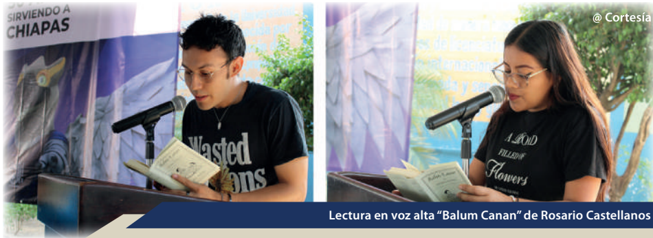
Lectura en voz alta "Balum Canan" de Rosario Castellanos

integradores elaborados por 258 estudiantes. Este evento académico, realizado al final del ciclo escolar, evaluó las competencias de estudiantes a través de los proyectos desarrollados bajo la coordinación de 15 docentes, con la participación de 27 evaluadores y evaluadoras, que incluyen docentes, egresados, egresadas y personas expertas externas.