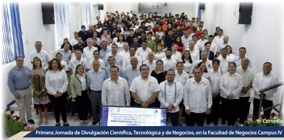
Primera Jornada de Divulgación Científica, Tecnológica y de Negocios, en la Facultad de Negocios Campus IV

En otro ámbito, la Facultad de Ciencias de la Administración, Campus IV, llevó a cabo la Primera Semana de la Administración, titulada “Liderazgo e innovación para las organizaciones actuales y del futuro”, celebrada del 12 al 16 de agosto en las instalaciones del Teatro de la Ciudad de Tapachula. Esta iniciativa busca ofrecer a la comunidad universitaria oportunidades de crecimiento y desarrollo académico, reforzando su identidad institucional. Durante el evento, se organizaron foros con la participación de docentes y administrativos jubilados, lo que permitió reflexionar sobre el legado de la facultad y estrechar los vínculos con los sectores público, empresarial y social de la región.