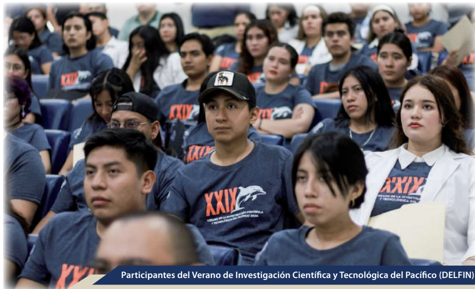
Participantes del Verano de Investigación Científica y Tecnológica del Pacífico (DELFIN)

La UNACH también fomenta la internacionalización en casa mediante la Muestra Cultural Internacional, realizada semestralmente en el Centro de Convenciones Manuel Velasco Suárez y en el teatro hundido de la UNACH durante la 10ª Feria Internacional del Libro 2024. A través de presentaciones de bailes, cantos y platillos típicos, los estudiantes de intercambio de países como Argentina, España, Colombia y Perú, así como de estados mexicanos como Ciudad de México, Sinaloa y Zacatecas, compartieron sus culturas con la comunidad universitaria, brindando a los estudiantes locales una visión global y oportunidades para futuras estancias académicas en el extranjero.