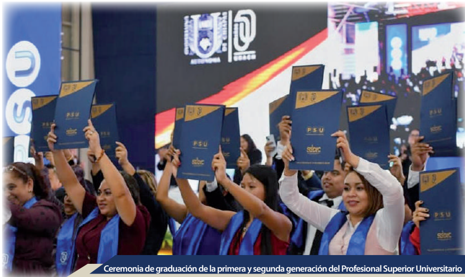
Ceremonia de graduación de la primera y segunda generación del Profesional Superior Universitario

Este año se celebró la primera ceremonia de graduación del Programa Profesional Superior Universitario (PSU), con un total de 132 estudiantes egresados de ellos 67 son mujeres y 65 hombres; del total 113 se graduaron 60 mujeres y 53 hombres, es decir el 85% logró obtener su título en cinco programas: Agropecuario y Forestal, Bienestar Humano y Comunitario, Desarrollo Socioeconómico, Infraestructura y Desarrollo Comunitario y Justicia Social. Esta ceremonia no solo refleja el éxito de una modalidad educativa innovadora, sino también el compromiso