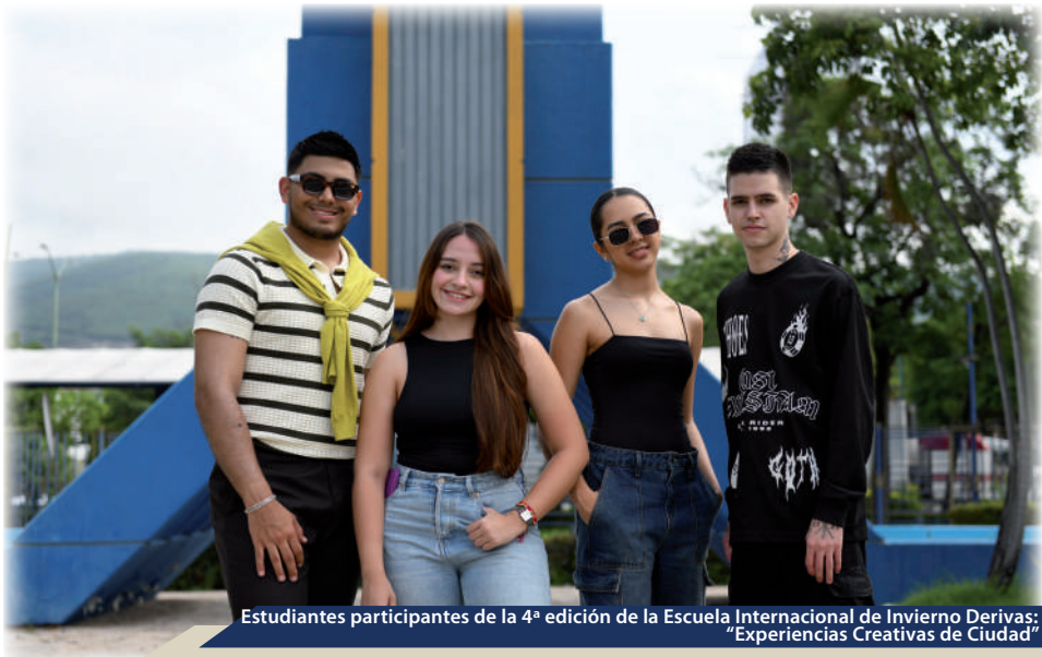
Estudiantes participantes de la 4ª edición de la Escuela Internacional de Invierno Derivas: “Experiencias Creativas de Ciudad”

En colaboración con SHE WINS MÉXICO, se llevó a cabo el proyecto multisede “Service Learning” entre la Universidad Central de Florida y la UNACH del 24 de mayo al 1 de junio de 2024. Esta iniciativa reunió a 10 estudiantes y dos docentes estadounidenses con 20 estudiantes y un docente de la Facultad de Medicina Humana “Dr. Manuel Velasco Suárez” Campus II, en actividades de salud y cultura en Chiapa de Corzo y San Cristóbal de Las Casas, fortaleciendo la vinculación social de ambas instituciones.