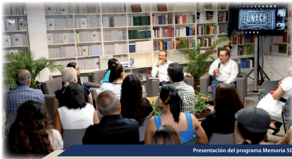
Presentación del programa Memoria 50

En relación con el programa de Profesional Superior Universitario (PSU), la Fundación UNACH ha otorgado becas del 75% para favorecer la reducción de las cuotas y permitir que más estudiantes accedan a