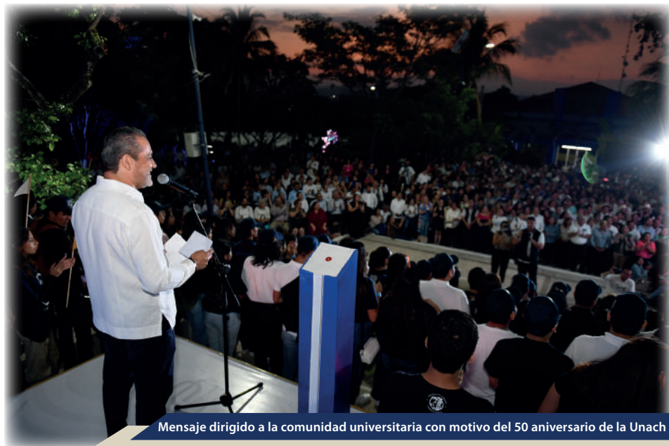
Mensaje dirigido a la comunidad universitaria con motivo del 50 aniversario de la Unach

En un emotivo mensaje transmitido a todos los campus a través de una plataforma digital, se destacó que este medio siglo representa más que solo un logro administrativo; simboliza el cumplimiento de una aspiración profunda del pueblo chiapaneco. La UNACH no ha sido solo un vehículo de formación académica, sino una fuerza constante en pro