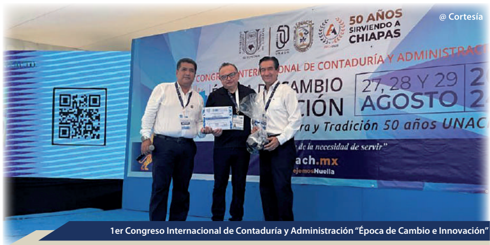
1er Congreso Internacional de Contaduría y Administración “Época de Cambio e Innovación”