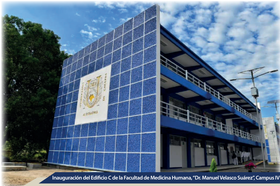
Inauguración del Edificio C de la Facultad de Medicina Humana, "Dr. Manuel Velasco Suárez", Campus IV

Las mejoras incluyen ampliación en la infraestructura de red y actualización en la Instalación de cableado estructurado, nodos, equipos de Access Point, swicht, en los edificios de Centro Universidad Empresa (CEUNE), Secretaría para la Inclusión Social y Diversidad Cultural,