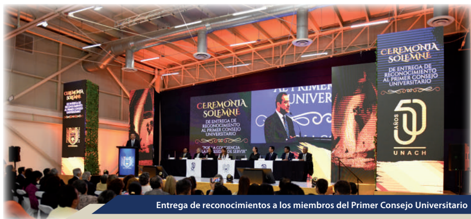
Entrega de reconocimientos a los miembros del Primer Consejo Universitario

Universitario y se autorizó el Plan y Programa de Estudios de la Maestría en Tecnologías para la Vivienda, que se impartirá en la Facultad de Arquitectura, Campus I.