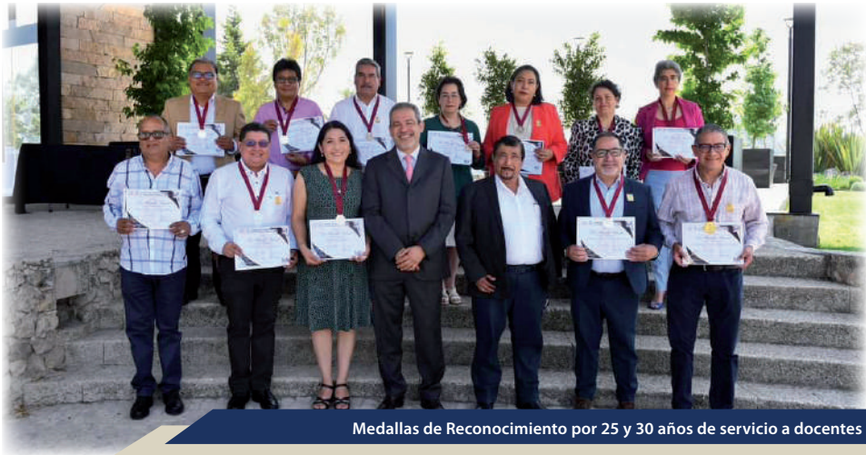
Medallas de Reconocimiento por 25 y 30 años de servicio a docentes

Como parte de las celebraciones por el 50 aniversario de esta institución, se otorgaron Medallas de Reconocimiento por 25 y 30 años de servicio a 49 docentes de los campus de Tuxtla Gutiérrez y San Cristóbal de Las Casas. Ser profesor universitario, en cualquier institución del mundo, es siempre un honor; en la UNACH, sus docentes asumen esta labor con integridad y dedicación, formando para Chiapas y el país a profesionales con sólidos conocimientos y valores fundamentales para el desarrollo de la sociedad.