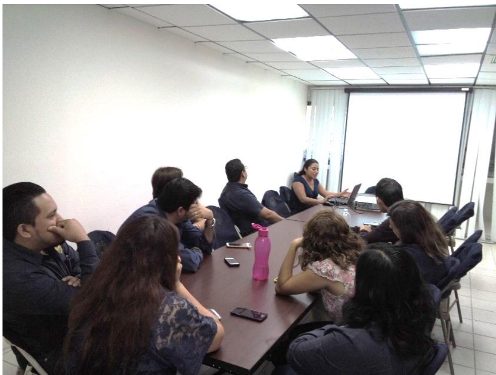
Ilustración 1: Reunión para el seguimiento del procedimiento institucional PO-721-01 Liberación de recursos de Gasto Corriente.

través de auditorías practicadas por dicha Asociación, comunicando los resultados a la Secretaría de Educación Pública, en atención a lo dispuesto en el citado precepto.