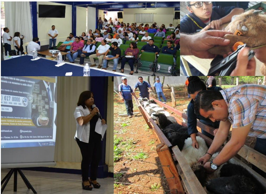
Ilustración 1: Capacitación del SIP-A y actividades de campo para el registro del inventario de semovientes.

Se estableció el control de semovientes por especie y etapas productivas en las seis áreas académicas de producción de la Universidad Autónoma de Chiapas, en la cual se integran: la Facultad de Ciencias Agrícolas, C-IV (Huehuetán, Chiapas), la Facultad de Ciencias Agronómicas, C-V, (Villaflores, Chiapas), la Facultad Maya de Estudios Agropecuarios, (Catazajá, Chiapas), la Facultad de Medicina Veterinaria y Zootecnia, C-II (Tuxtla Gutiérrez, Chiapas), la Escuela de Estudios Agropecuarios Mezcalapa (Copainalá, Chiapas), y el Centro de Estudios Etnoagropecuarios, (Teopisca, Chiapas), estableciendo los lineamientos para el llenado de la información de los semovientes de forma mensual por las Dependencias.