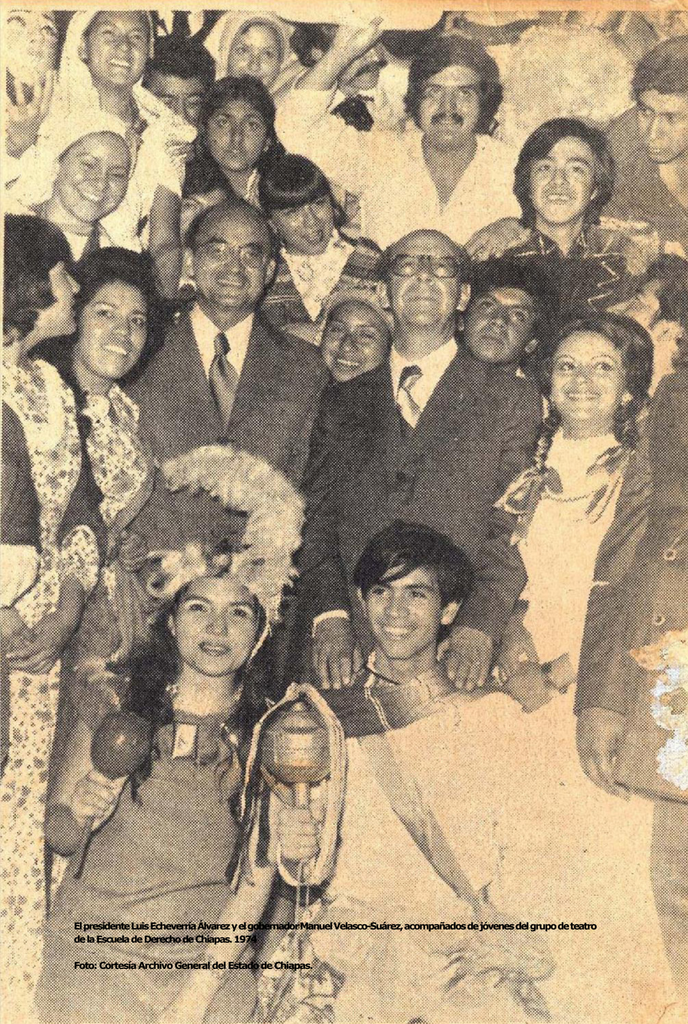
El presidente Luis Echeverría Álvarez y el gobernador Manuel Velasco-Suárez, acompañados de jóvenes del grupo de teatro de la Escuela de Derecho de Chiapas, 1974